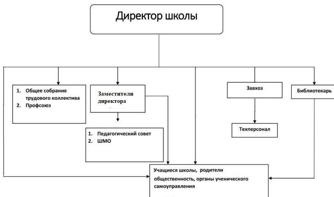
Таблица 6. Органы управления, действующие в Школе